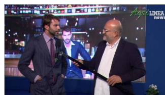
Intervista Host 2021 - Live