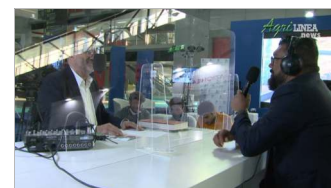
Intervista Host 2021 - Live

Ritaglio ad uso esclusivo del destinatario