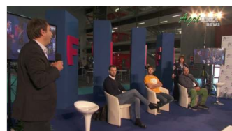
Talk Show Mondazione del food delivery