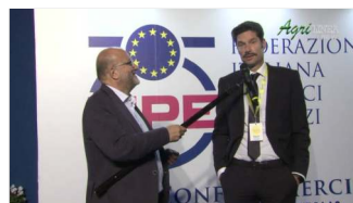
Intervista Host 2021 - Live 23 ottobre 2021