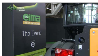
Speciale Agrilinea Fiera Internazionale 2021