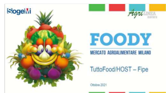
Talk Show Foody - Mercato Agroalimentare Milano 23 ottobre 2021