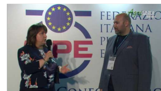
Intervista Host 2021 - Live 23 ottobre 2021