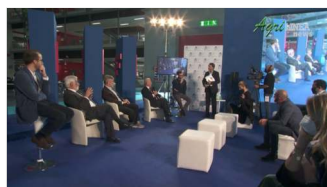
Talk Show La cantina digitale 23 ottobre 2021