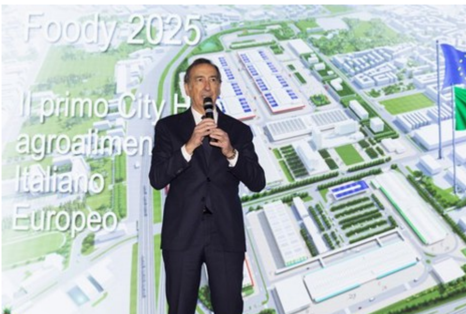
Il sindaco di Milano

Presentato dal sindaco e dal presidente di Sogemi nel dicembre 2019, il progetto Foody 2025 - avvalendosi della partnership finanziaria con Banco BPM attraverso un finanziamento di 45,6 milioni di euro - prevede il rinnovamento integrale del Mercato Agroalimentare Foody 2025 e rappresenta uno dei pilastri della Food Policy del Comune di Milano, con un investimento da oltre 300 milioni di euro e la più vasta area urbana attualmente cantierizzata per un totale di 700 mila mq di superficie fondiaria.