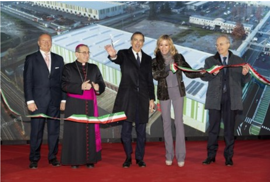
Il momento del taglio del